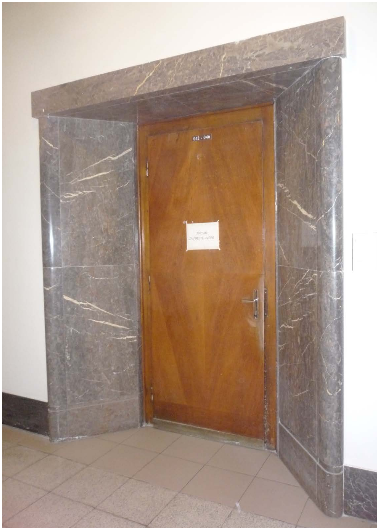
jižní křídlo – zvýšené 1.NP – dveře J4 – pohled vnější z hlavní chodby – stávající stav