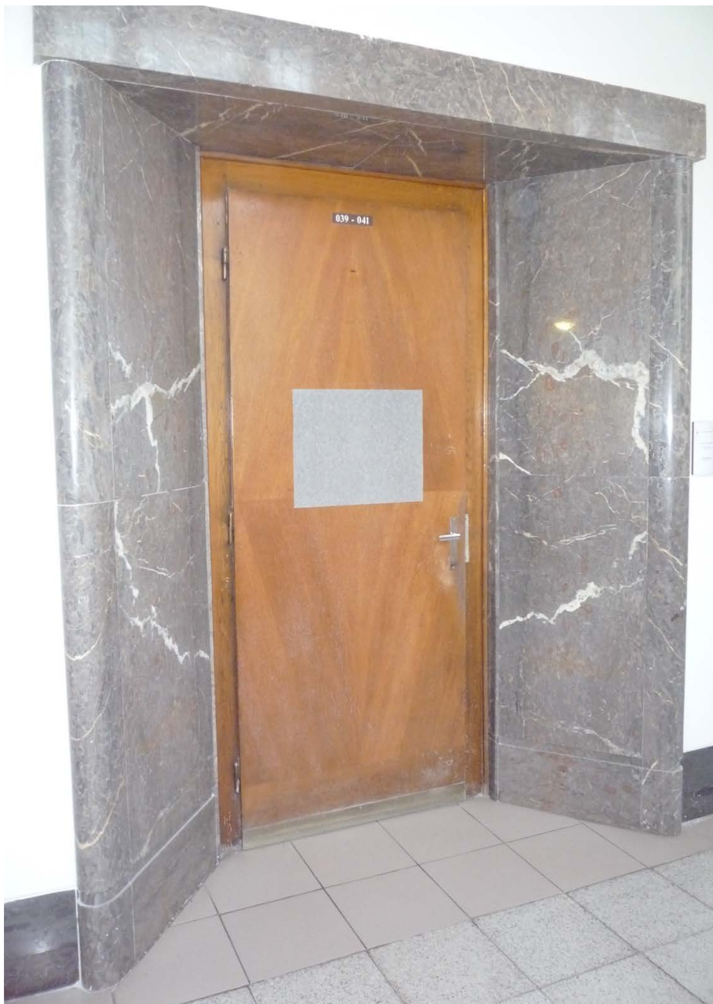
jižní křídlo – zvýšené 1.NP – dveře J5 – pohled vnější z hlavní chodby – stávající stav