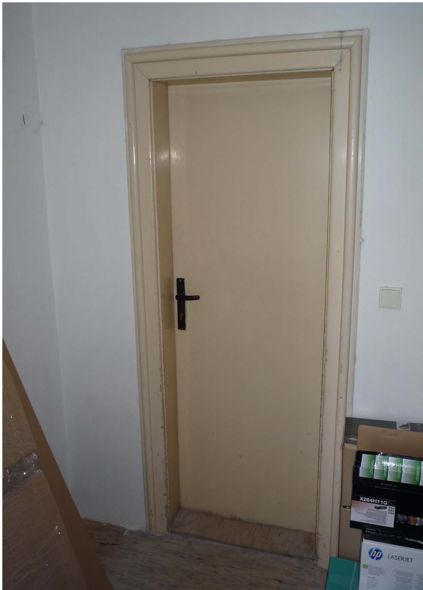
jižní křídlo – zvýšené 1.NP – dveře J7 – pohled vnitřní ze skladu – stávající stav