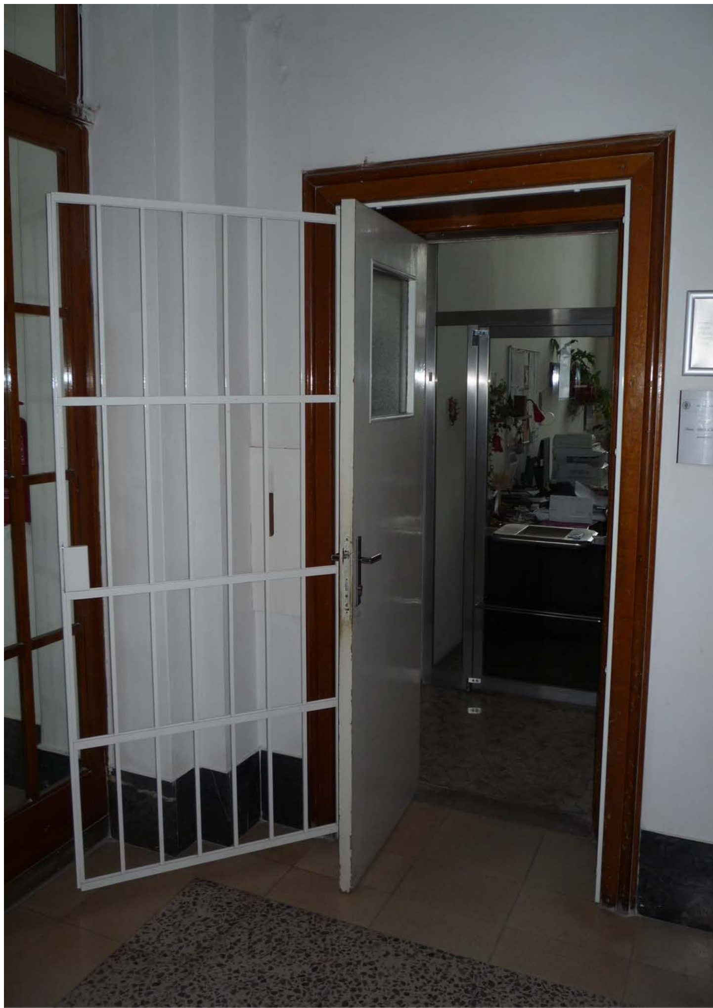
jižní křídlo – zvýšené 1.NP – dveře J1 – pohled vnější s otevřenou mříží i dveřmi – stávající stav