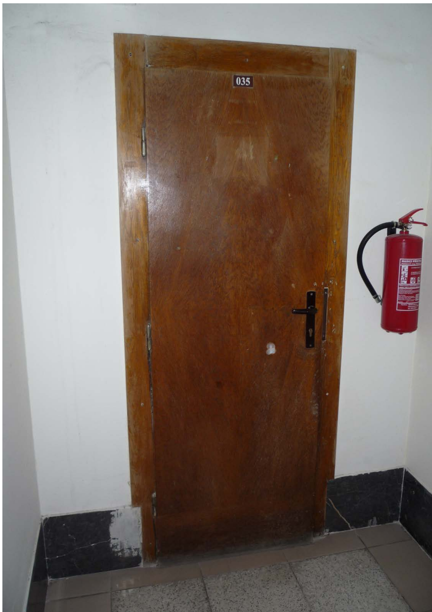
jižní křídlo – zvýšené 1.NP – dveře J7 – pohled vnější z hlavní chodby – stávající stav