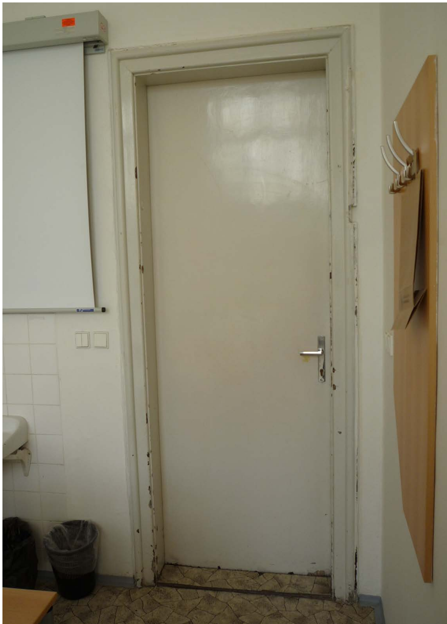
jižní křídlo – zvýšené 1.NP – dveře J2 – pohled vnitřní z kanceláře – stávající stav