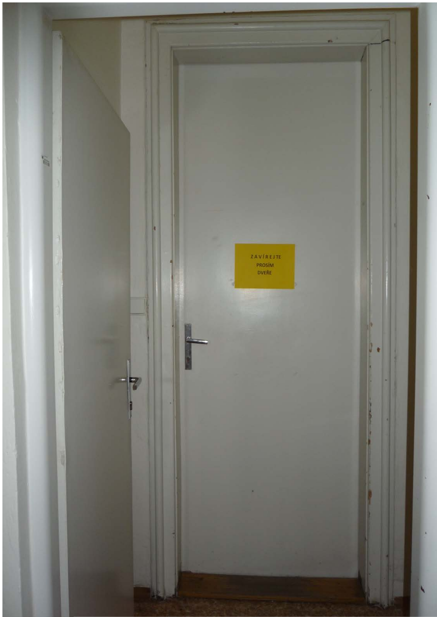
jižní křídlo – zvýšené 1.NP – dveře J3 – pohled vnitřní z předsíně – stávající stav