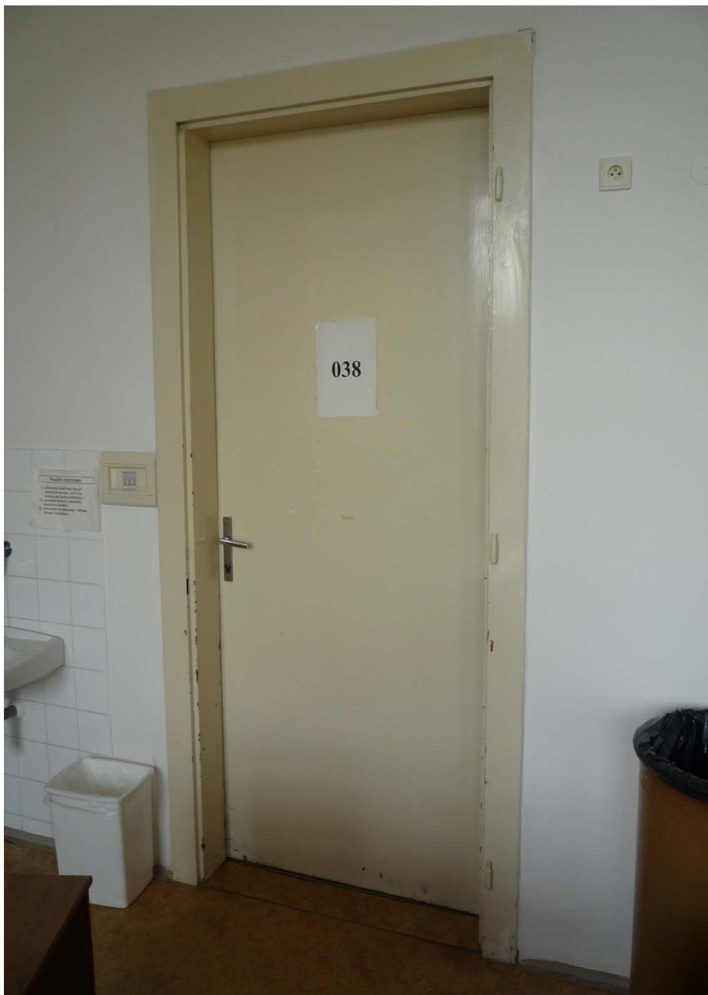
jižní křídlo – zvýšené 1.NP – dveře J6 – pohled vnitřní z učebny – stávající stav