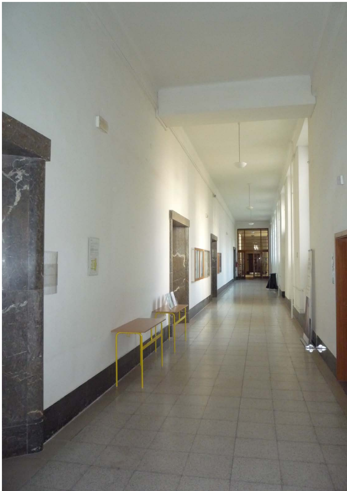
Brno, Veveří 70, budova PrF MU - chodba jižního křídla ve zvýšeném 1.NP – stávající stav