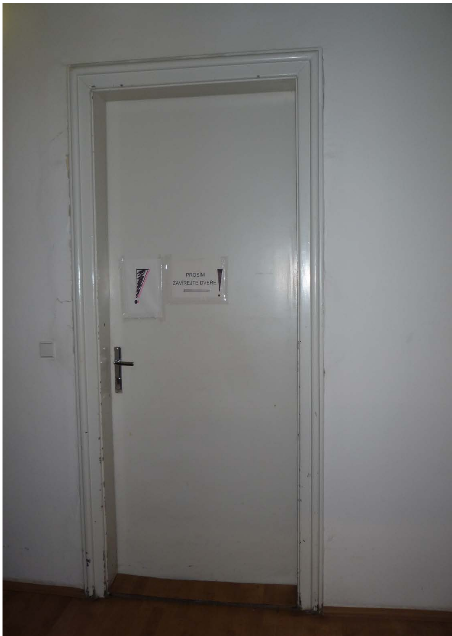
jižní křídlo – zvýšené 1.NP – dveře J4 – pohled vnitřní z předsíně – stávající stav