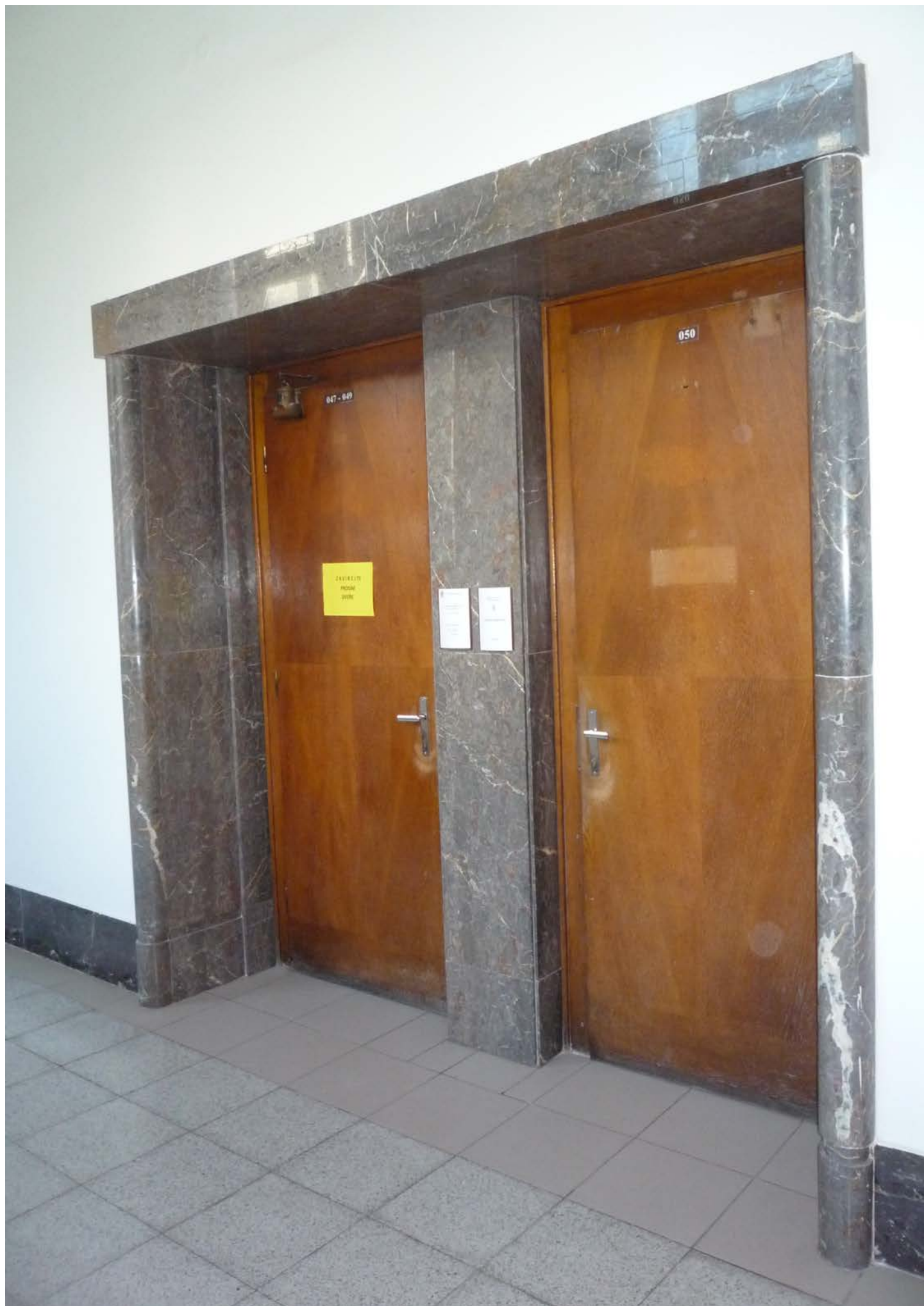
jižní křídlo – zvýšené 1.NP – dveře J2 a J3 – pohled vnější z hlavní chodby – stávající stav