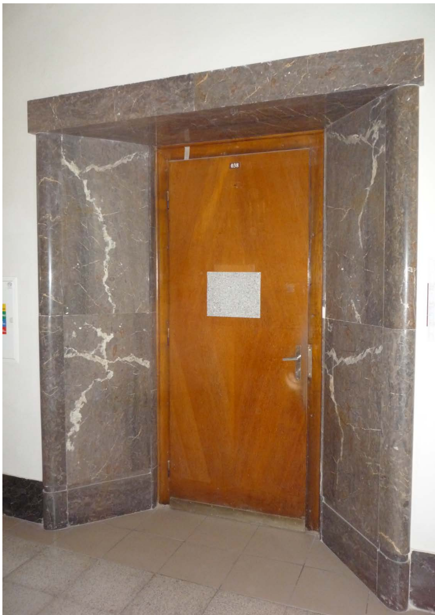
jižní křídlo – zvýšené 1.NP – dveře J6 – pohled vnější z hlavní chodby – stávající stav