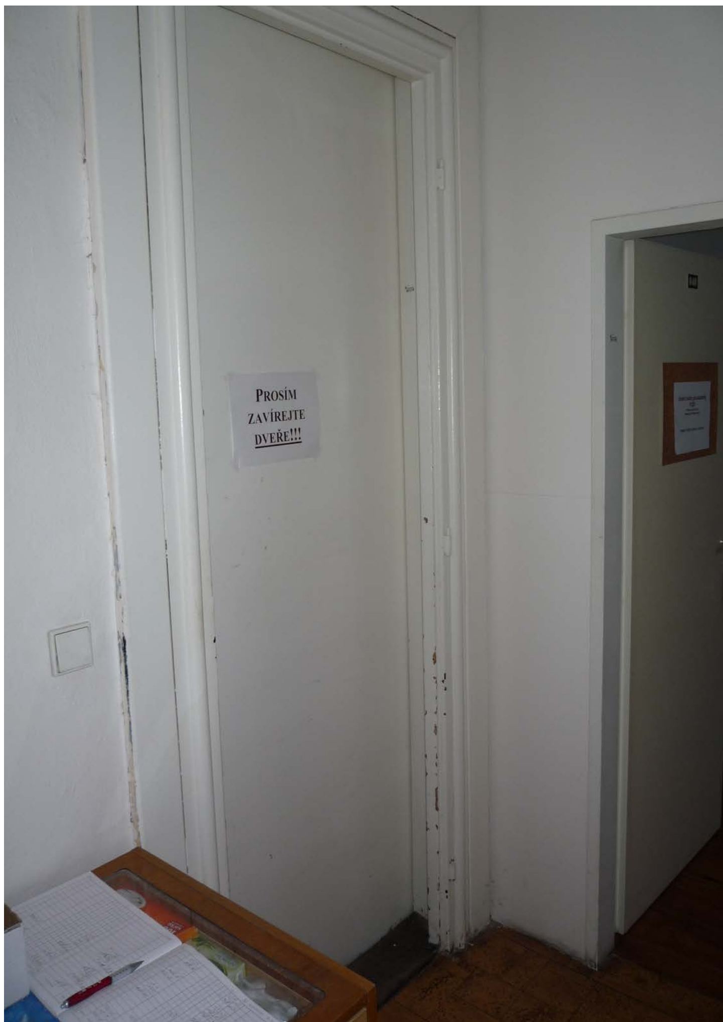
jižní křídlo – zvýšené 1.NP – dveře J5 – pohled vnitřní z předsíně – stávající stav