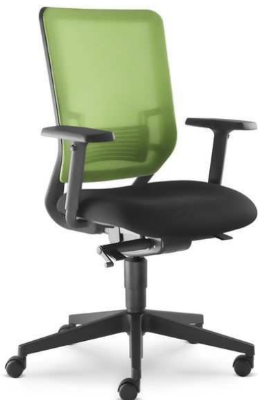
Designový vzor: LD seating WHY 350-AT, čalounění Silvertex Delft