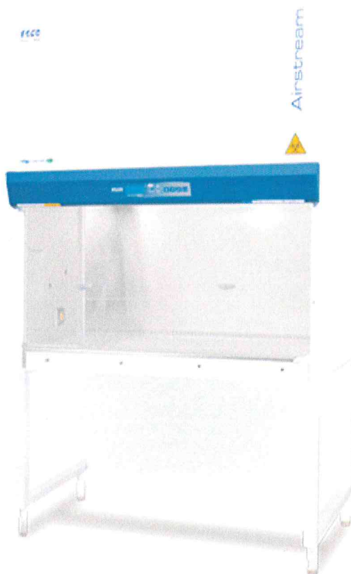
Biohazard box třídy II