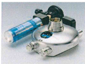
Plynový kahan s kartuší