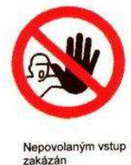
obr.1 (bezpečnostní značení)

Celý areál staveniště bude oplocen do výšky 1,8 m a na každém vstupu bude na viditelném místě umístěna bezpečnostní tabulka „Zákaz vstupu nepovolaným osobám" a na každém vjezdu do areálu bude dopravní značka omezující rychlost vozidel v areálu.